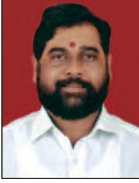
शिंदे, श्री. एकनाथ संभाजी