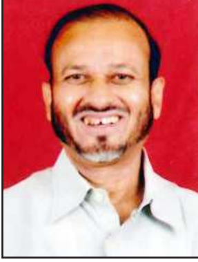
पाडवी, अॅड. के. सी.